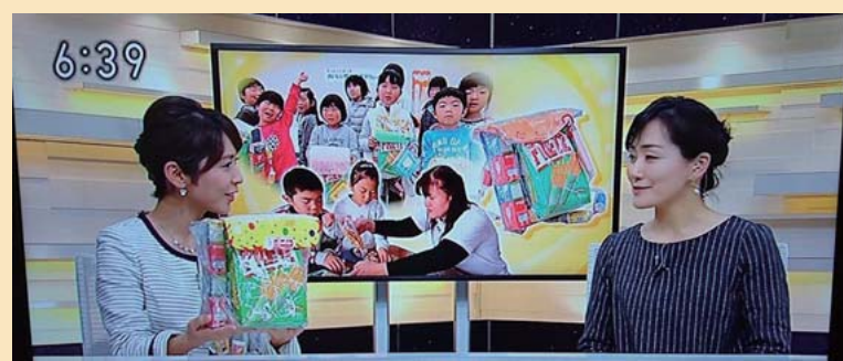
▲▼NHKニュースKOBEBEに放送された画像

2016年5月より始動している 「おいしい防災塾」が NHKの取材を受け 2017年1月18日18:30～19:00 NHKニュースKOBEBEに 7分強の放送で紹介されました。